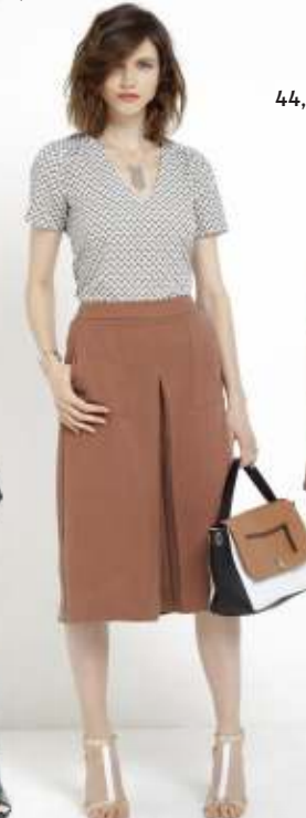
39,99 €, Laura Clement pour La Redoute, www.laredoute.be .