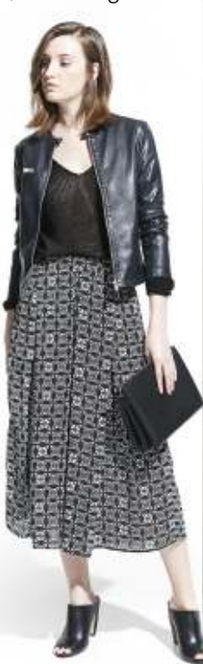
44,99 €, Mango, www.mango.com .

Franchement, c'est un peu la même chose. L'idée est celle d'un pantalon large, fluide ou non, toujours sous le genou, qui fait l'effet d'une jupe. Peu importe le nom, pourvu qu'on ait le confort et le look (du bécébébé à l'estival).